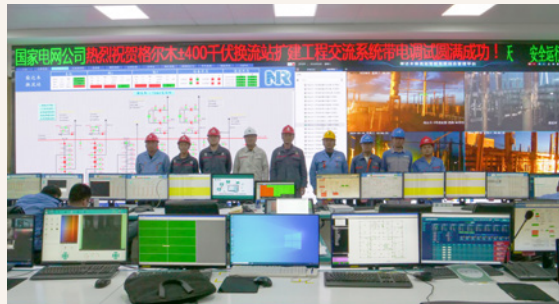
设计、施工单位成立突击小组，从事前、事中、事后三个方面对二次作业进行控制。事前将所有可预判的风险进行归纳、把控，事中通过过程监督把控施工每一步骤，

青藏直流扩建工程相当于两个直流工程并联，属国内首创，格尔木换流站运行十几年，历经数十次改造，地下管线错综复杂，工程建设面临停电次数多、二次接入复杂、与老旧设备联调等困难。项目监理部组织业主、